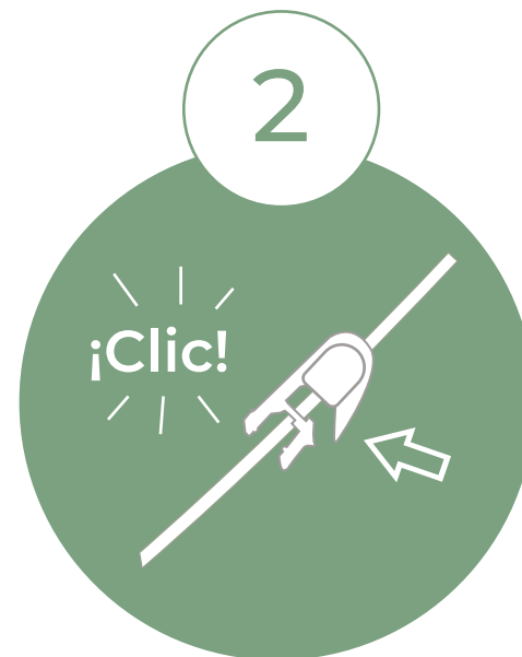
CLAMPAJE DEL PROLONGADOR DE LA AGUJA HUBER

El uso del clamp impide el paso de suero