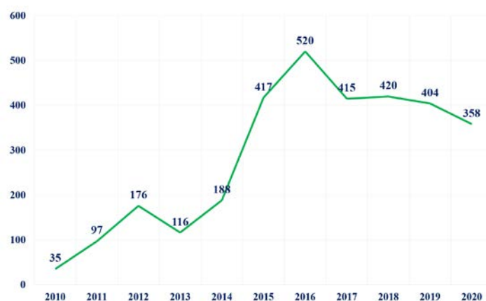
Fig. 5 Receptores de leche donada del BLHNV desde 2010

En total desde el inicio de su actividad 3156 neonatos enfermos, fundamentalmente prematuros se han beneficiado de la actividad de este Banco.