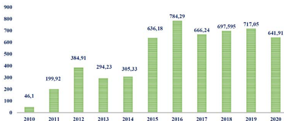
Fig. 4. Volumen de leche distribuida por el BLHNV desde 2010

Además de la Unidad de Neonatología del propio Hospital Materno Infantil Virgen de las Nieves de Granada.