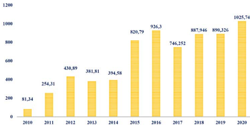
Fig. 3 Volumen de Leche pasteurizada en el BLHNV desde 2010

En el año 2020 se han procesado un total de 1.025,74 L de leche donada.